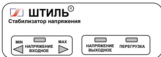
Рисунок 4.1 Передняя панель стабилизатора

На одной боковой стенке стабилизатора расположена розетка с заземляющим контактом для подключения нагрузки, а на другой – автоматический предохранитель 2А (у стабилизатора R250ST) или 5А (у стабилизаторов R400ST, R600ST), или 10А (у стабилизатора R800ST), выключатель СЕТЬ и выведен сетевой шнур для подключения стабилизатора к сети.