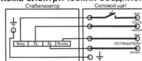
Схема электрических соединений серия «G»